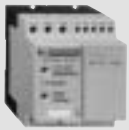
LH4 6 - 85 A