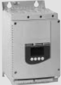
Altistart 48 17 - 1200 A

İlgili TeSys komponentleriyle performansınızı artırın*