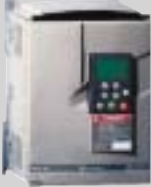
Altivar 58 0.37 - 75 kW