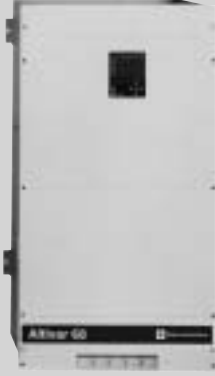
Altivar 68 75 - 630 kW